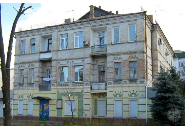
Синагога Скловського. Нині – житловий будинок.

Будинок збудували у 1880 році. На той час це була друга синагога у Черкасах. Перша, дерев'яна, розмішувалася внизу, на вулиці Єврейська, нині Гагаріна.