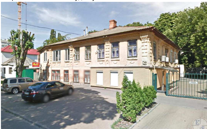
Синагога по вулиці Святотроїцька.