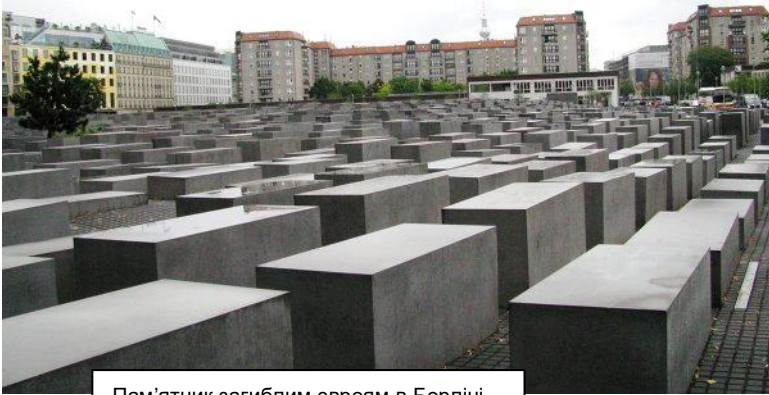
Пам'ятник загиблим євреям в Берліні

до існування. Багато з цих законів нав'язували політику „арізації“ – передачу єврейських промислових підприємств та майна у „арійське“ володіння, як правило, за копійчану ціну. Далі законодавство заборонило євреям, які вже не мали права працювати на державних підприємствах, застосовувати свої професійні знання у приватному секторі та шукало подальші шляхи витіснення євреїв із життя суспільства. Німецьке керівництво виключило єврейських дітей із німецьких шкіл. Євреї Німеччини втратили можливість мати водійські права та володіти автомобілями. На додаток до цього, закон вніс обмеження користування громадським транспортом. Євреї більше не допускалися до „німецьких“ театрів, кінотеатрів та концертних залів.