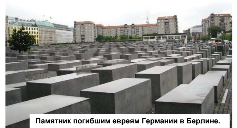
Памятник погибшим евреям Германии в Берлине.

Ежегодно в Международный день против фашизма, расизма и антисемитизма во многих странах проходят тематические мероприятия – выставки, митинги, демонстрации и другие акции в память о жертвах нацизма, жертвах террора на национальной, расистской, в частности, антисемитской почве.