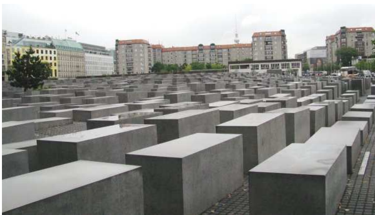
Памятник погибшим евреям Германии в Берлине.

Согласно оценкам историков, практически полное отсутствие реакции на погром как внутри самой Германии, так и в других странах Европы развязало фашистам руки и послужило стимулом к началу массового уничтожения европейских евреев. „Хрустальная ночь“ явилась поворотным пунктом в судьбе германского и австрийского еврейства и прямым прологом одного из самых страшных преступлений нацистского режима – массового истребления евреев – Холокоста, которое привело к гибели более шести миллионов евреев.